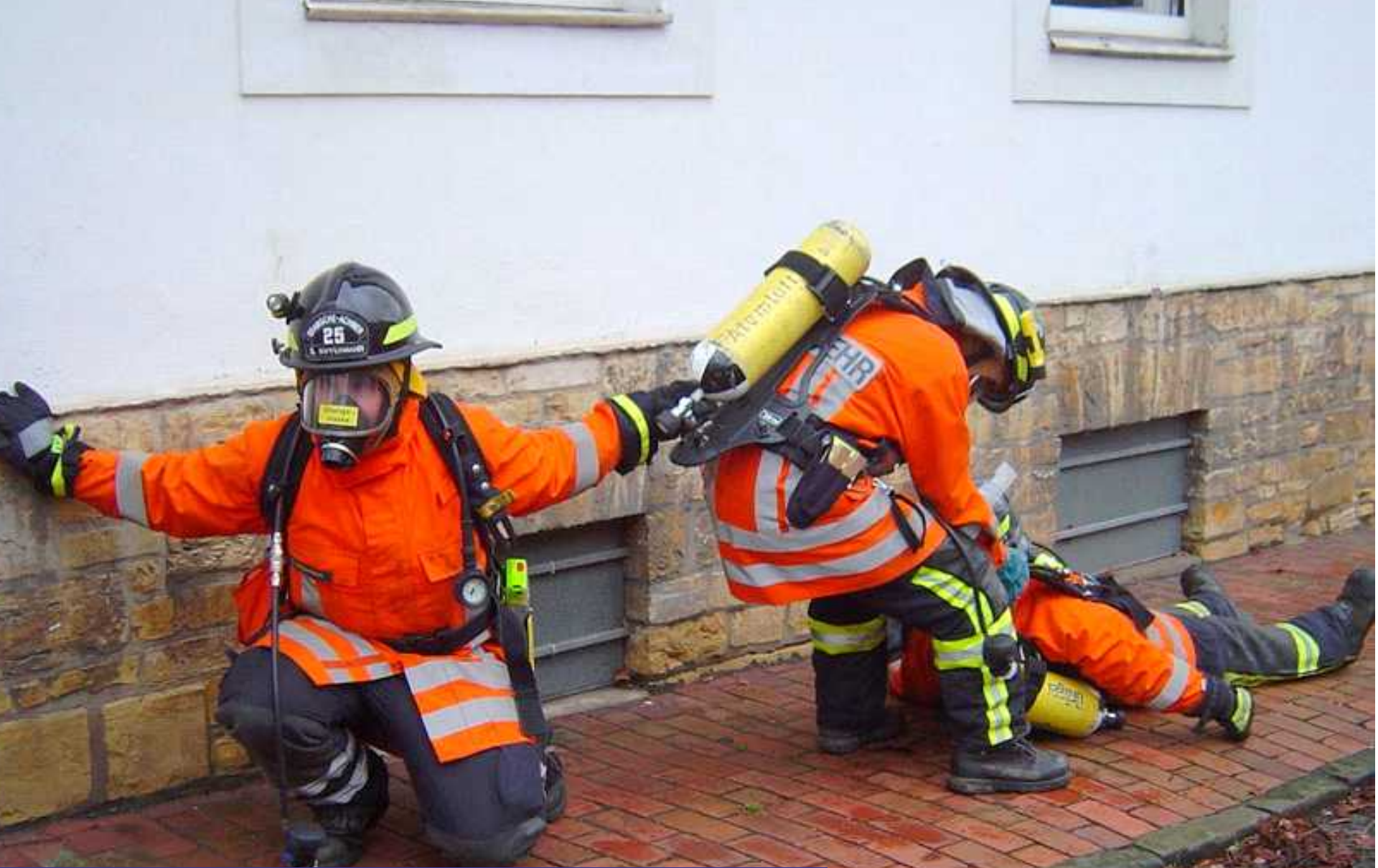
Si-Truppführer hält Wand/Leinenkontakt und führt den Si-Truppmann am PA