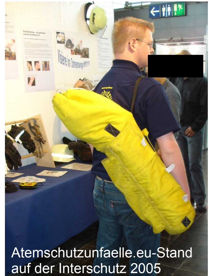
Atenschutzunfaelle.eu-Stand auf der Interschutz 2005